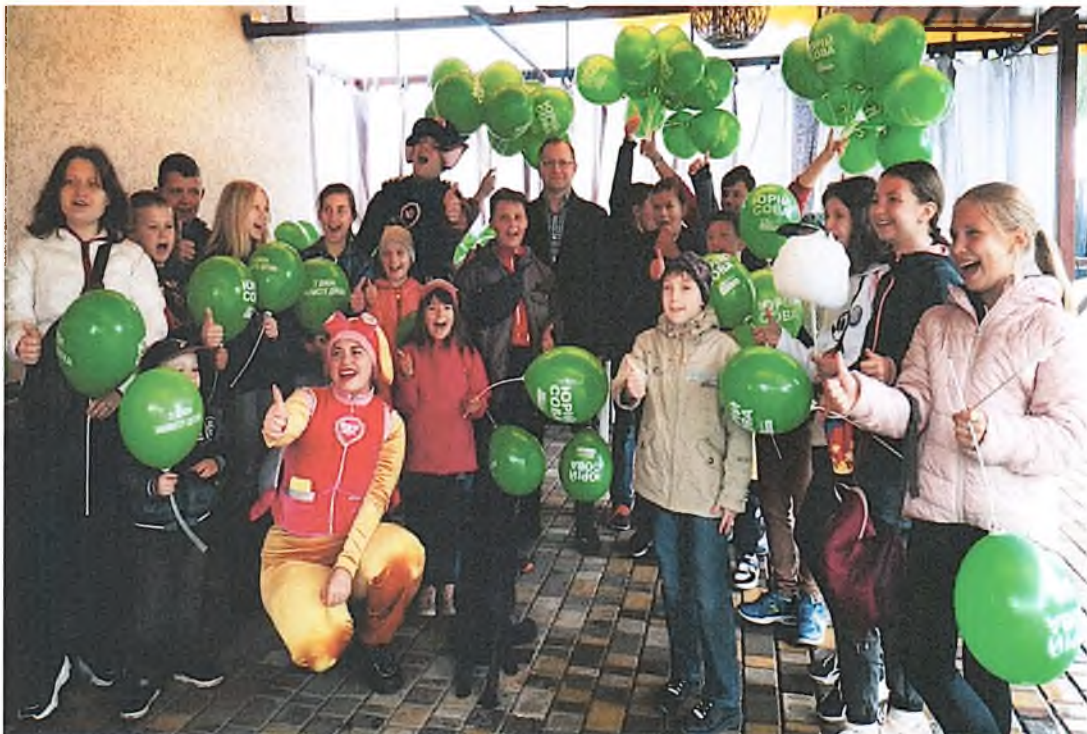
Дитяче свято з приводу Дня захисту дітей