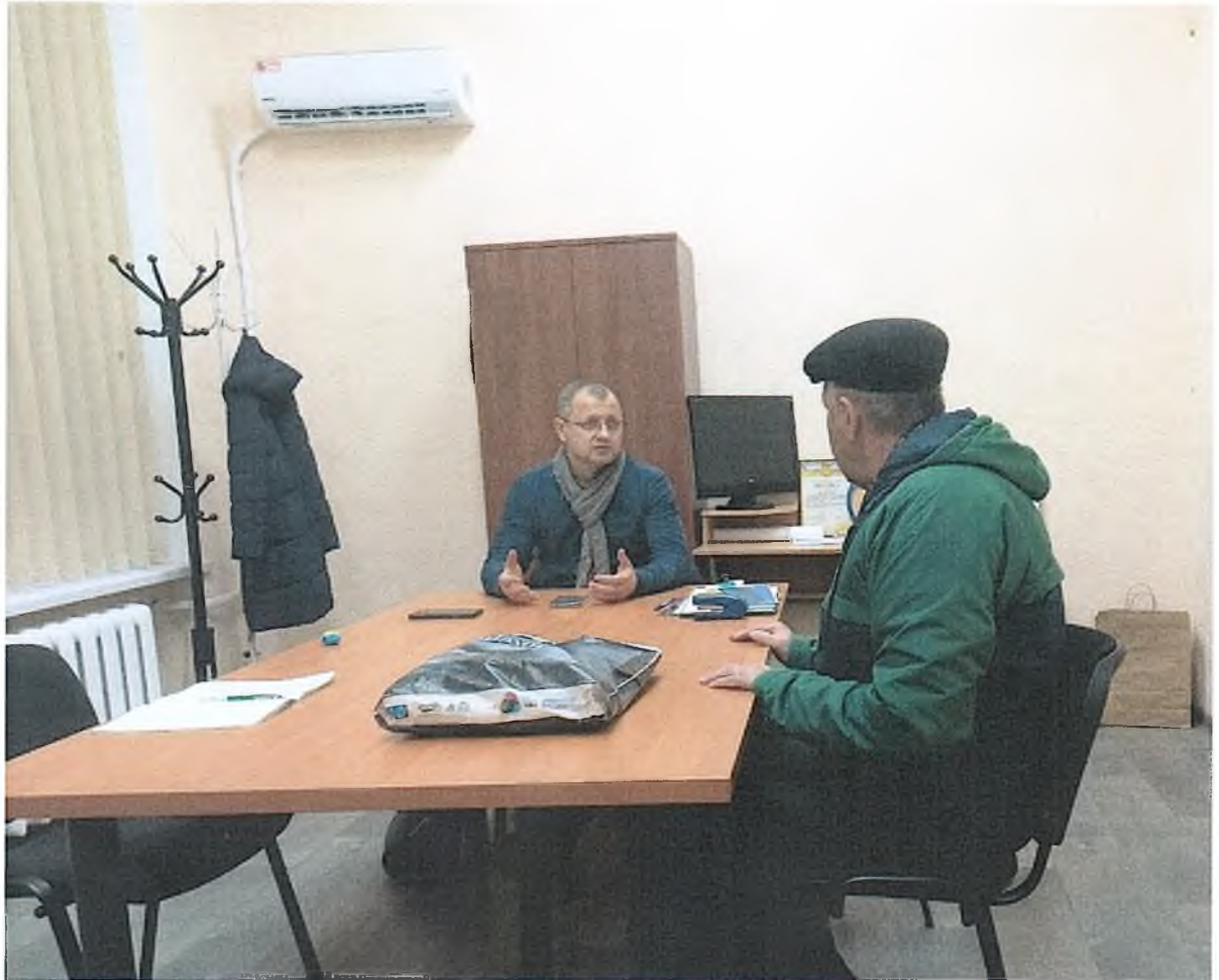
Особистий прийом у громадській приймальні депутата

Постійно особисто комунікую з мешканцями Криворізької міської територіальної громади, обмінюємося інформацією, у тому числі через сторінку у мережі Facebook.